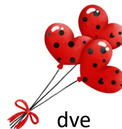
dve 16-tinové noty